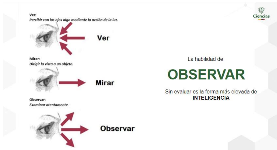
Imagen 7. Habilidad de Observar

La Auditoría interna es un ejercicio de comunicación estratégica en el que se deben enviar mensajes comunes y compartidos, que deben ser entendidos por todos los equipos. Ese es el gran reto que se pide afrontar en materia de la auditoría de recertificación, en la que revisan el sistema completo. Debe ser coherente entre lo que está documentado con lo que se desarrolla día a día.