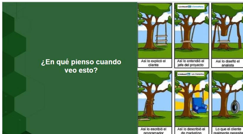
Imagen 1. El Mensaje

Para ello, se usó una primera imagen para transmitir un mensaje: