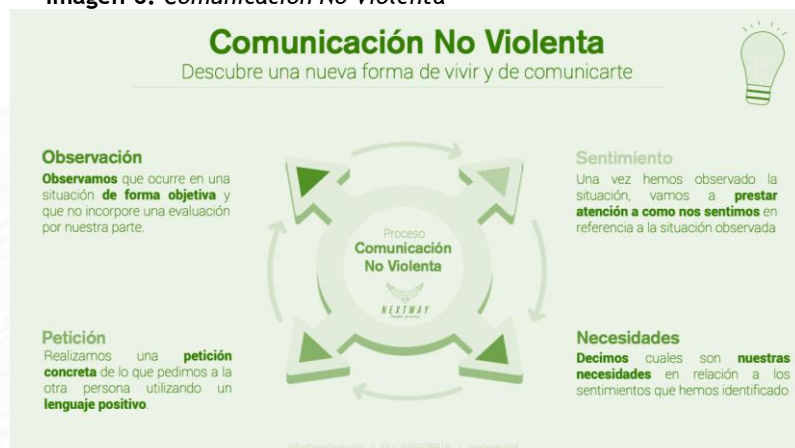
Imagen 6. Comunicación No Violenta

En este sentido, se presentó la metodología de Comunicación No Violenta (CNV) como una herramienta basada en los principios de observación, sentimientos, necesidades y peticiones, la CNV en el contexto de las metodologías ágiles fomenta interacciones respetuosas, empáticas y claras, lo que permite optimizar las interacciones. Esto no solo evita confrontaciones, sino que también favorece la divergencia y convergencia de ideas, creando un clima de confianza en el que los equipos pueden resolver conflictos de manera constructiva, promoviendo la productividad y la innovación continua. A continuación, se presentan los elementos claves de la comunicación no violenta.