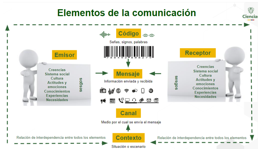
Imagen 2. Elementos de la comunicación

El mensaje inicial del encuentro subrayó que todos los Agentes C4 están llamados a promover una comunicación ágil y de calidad. Para reforzar este mensaje, se realizó una actividad de reflexión frente a los posibles distractores y factores que pueden generar distorsión en el mensaje que se transmite y qué técnicas o hábitos se pueden implementar para mejorar la capacidad de discernir la información importante y minimizar la influencia de los distractores