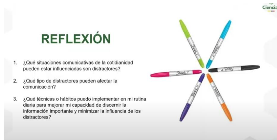
Imagen 5. Actividad de reflexión - Distractores

Para analizar que tan buenos lectores son de los mensajes se implementó un reto de comunicación en el cual se abordaron los distractores que influyen la comunicación.