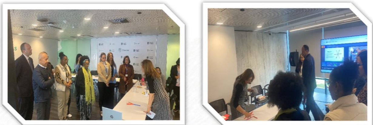
Imagen 3. Actividad de Reflexión - Distractores en la comunicación

De ella, se resaltó la importancia de contar con información completa para la toma de decisiones; la necesidad de encontrar la mejor forma de transmitir un mensaje; y, finalmente, que cada uno está llamado a movilizar a partir de una comunicación ágil y de calidad, desde una mirada multidisciplinar y multigeneracional para llegar a un objetivo común creando espacios para la divergencia y actitud para la convergencia.